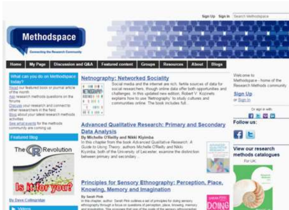
Figura 3. Pantalla principal red social científica Methodspace

Dirección electrónica: http://www.methodspace.com/