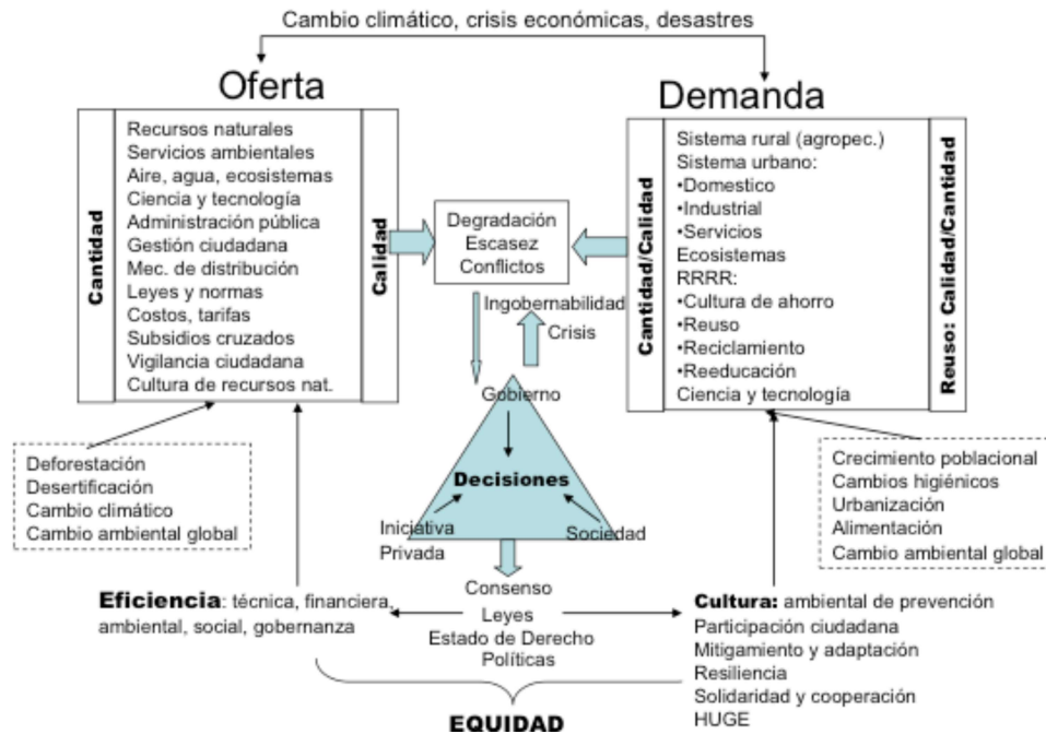
Gráfica 3: Eficiencia con equidad en el manejo del recurso agua.

Sin duda, las inundaciones impactan; no obstante, si se revisan los datos de muertes y daños materiales es la sequía que silenciosamente causa mayores daños y obliga frecuentemente a regiones enteras a migrar (Oswald et al., 2014). Durante el siglo XX el proceso de desertificación ha avanzado y se contempla una degradación entre 15 y 24% de la superficie de tierras productivas en el planeta (UNCCD, 2009).